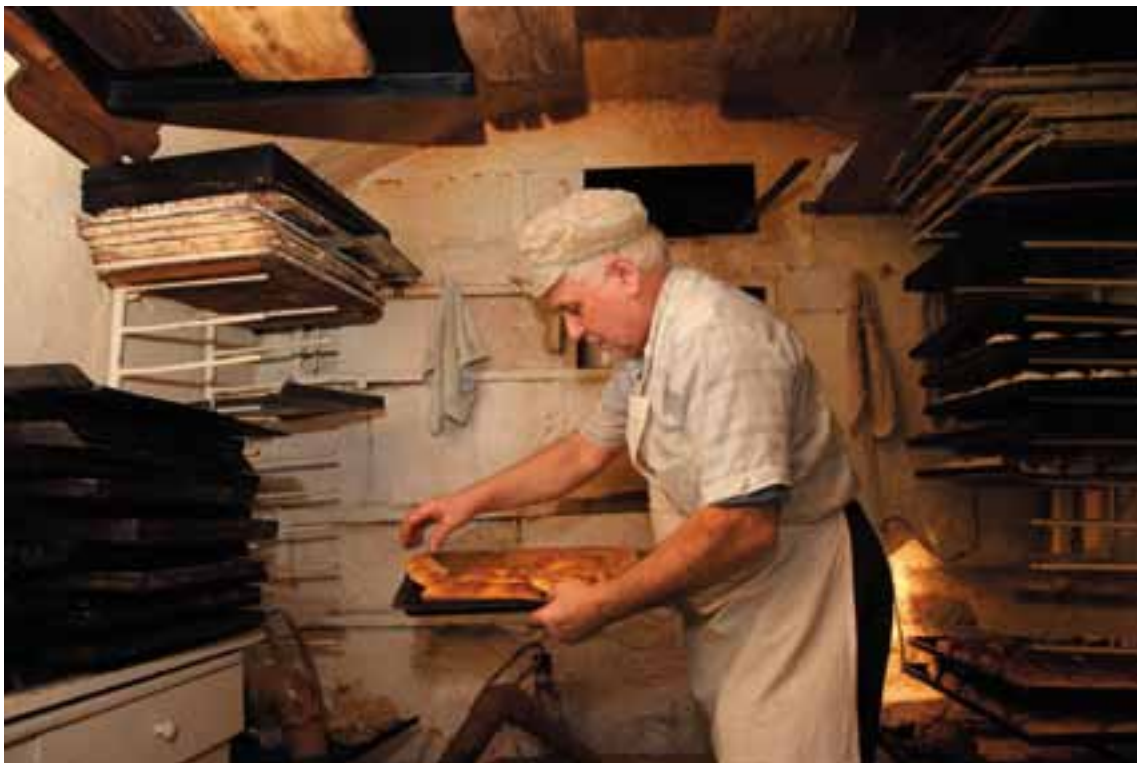
„Cukiernik z ulicy Małej w Kielcach, cz. 2”