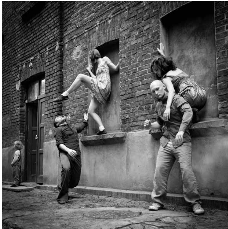
„Taniec miasta, cz. 2”